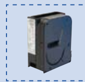
Geldscheinprüfer Money control